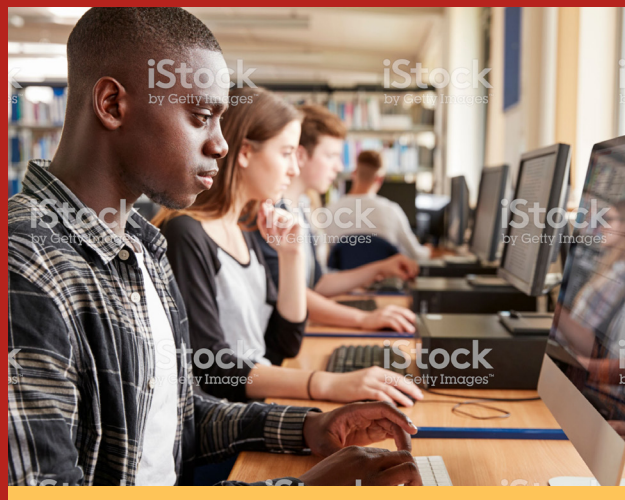
Image caption Omnis earia sundi dolorrovit occuptas et verum, que peli-quo offic tem. Ut ea nam elles sit litate sum unt