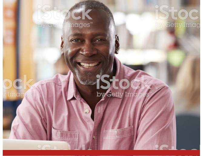
Image caption Omnis earia sundi dolorrovit occupatas et verum, que peli-quo offic tem. Ut ea nam elles sit litate sum unt