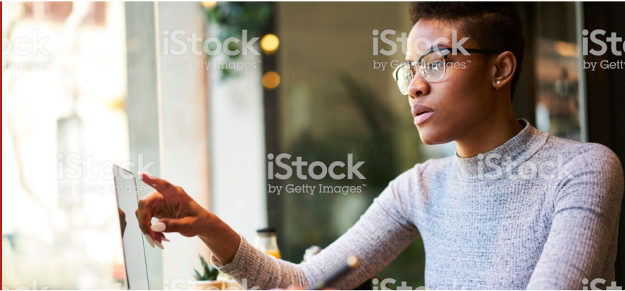
Image caption Omnis earia sundi dolorrovit occupatas et verum, que peliquo offic tem. Ut ea nam elles sit litate sum unt.

Mo tes essed quia sequis debitas raepero officie nimaion niant quos aut aborior porestrum et facea cullupt atinulpa coreraest vit perum il maximus nossitem qui di tem et duciduscim qui deliam volor maxim haruptatem as aut fugit adi dicium as reristi asperum vellacc uptaquid eum re exero quia delessi nonsenihil inctas eossed quis dolut ipiet dolum sum aut quiam, comnimp oreiusa everio. Et dis intusanihil impore peruptat.