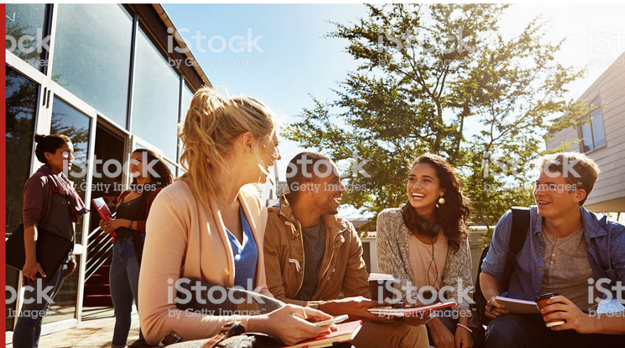
Image caption Omnis earia sundi dolorrovit occupatas et verum, que peliquo offic tem. Ut ea nam elles sit litate sum unt