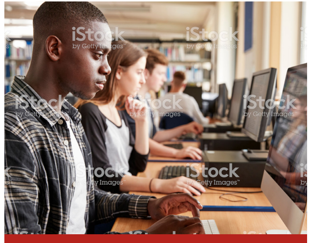
Image caption Omnis earia sundi dolorrovit occuptas et verum, que peli-quo offic tem. Ut ea nam elles sit litate sum unt