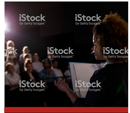
Image caption Omnis earia sundi dolorrovit occupatas et verum, que peliquo offic tem. Ut ea nam elles sit litate sum unt