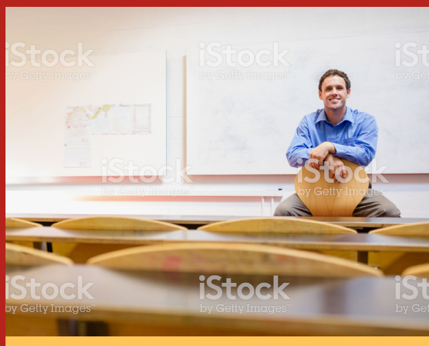
Image caption Omnis earia sundi dolorrovit occuptas et verum, que peli-quo offic tem. Ut ea nam elles sit litate sum unt