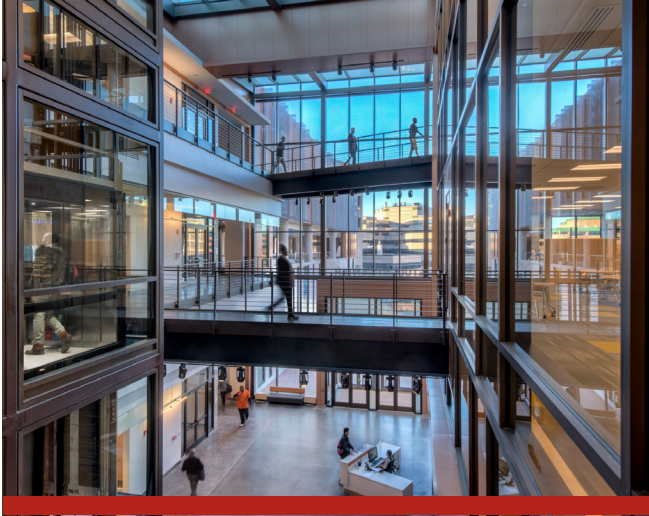
Image caption Omnis earia sundi dolorrovit occupatas et verum, que peli-quo offic tem. Ut ea nam elles sit litate sum unt