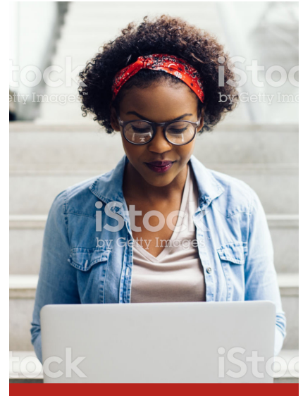
Image caption Omnis earia sundi dolorrovit occupas et verum, que peliquo offic tem. Ut ea nam elles sit litate sum unt