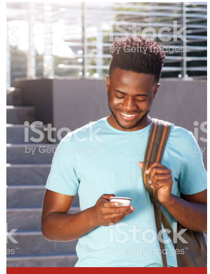
Image caption Omnis earia sundi dolorrovit occupas et verum, que peliquo offic tem. Ut ea nam elles sit litate sum unt © Photographer Name.