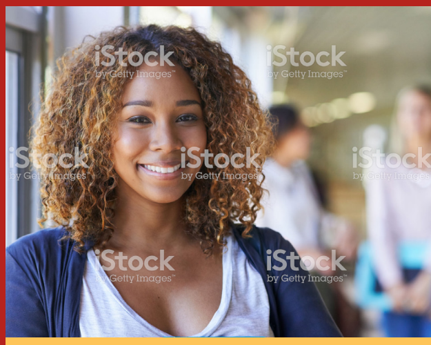
Image caption Omnis earia sundi dolorrovit occuptas et verum, que peli-quo offic tem. Ut ea nam elles sit litate sum unt