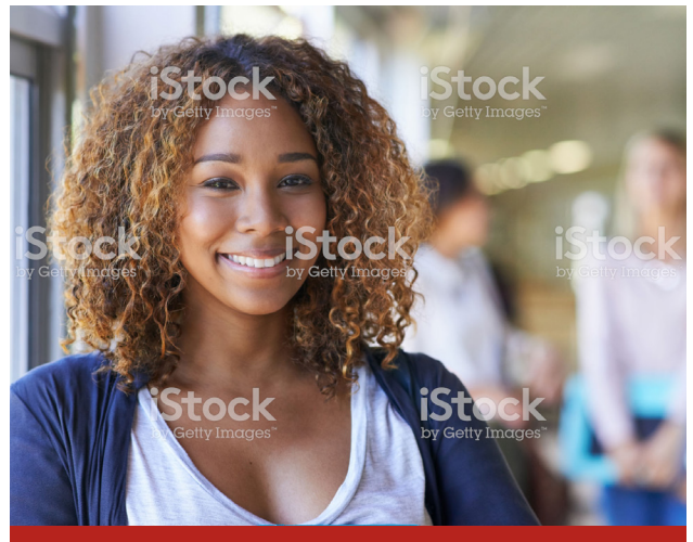
Image caption Omnis earia sundi dolorrovit occuptas et verum, que peli-quo offic tem. Ut ea nam elles sit litate sum unt