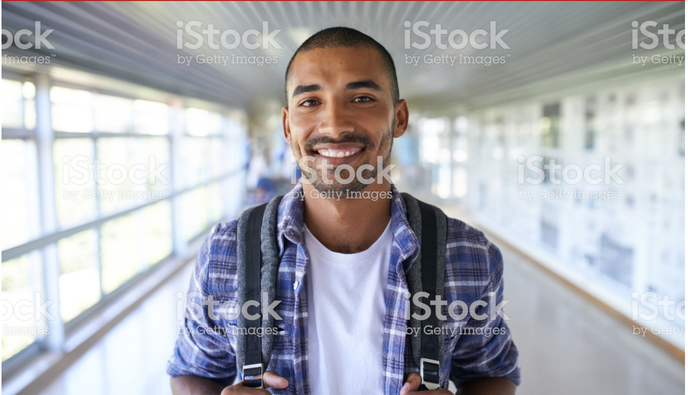
Image caption Omnis earia sundi dolorrovit occuptas et verum, que peliquo offic tem. Ut ea nam elles sit litate sum unt