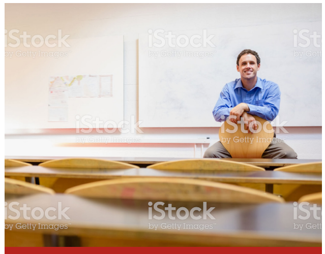
Image caption Omnis earia sundi dolorrovit occuptas et verum, que peli-quo offic tem. Ut ea nam elles sit litate sum unt