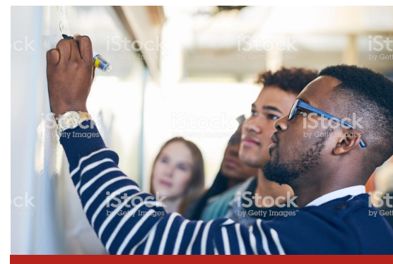
Image caption Omnis earia sundi dolorrovit occuptas et verum, que peliquo offic tem. Ut ea nam elles sit litate sum unt

Harchitatis mo quidign iatatet, sinvel eum velic totaquas que velest prenem