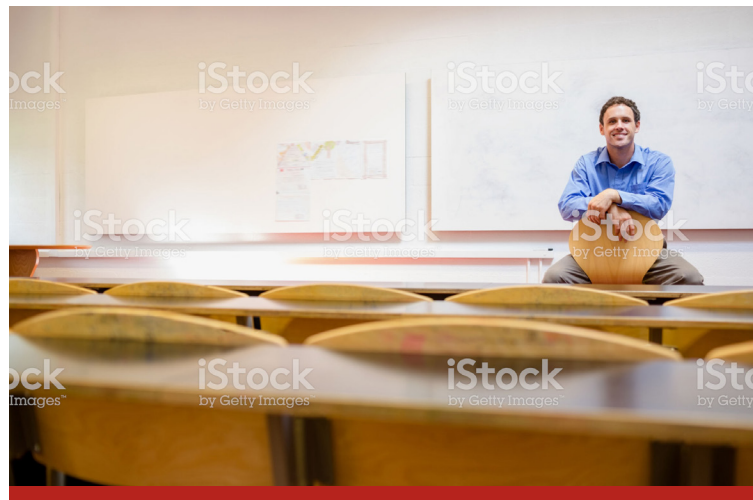
Image caption Omnis earia sundi dolorrovit occuptas et verum, que peli-quo offic tem. Ut ea nam elles sit litate sum unt