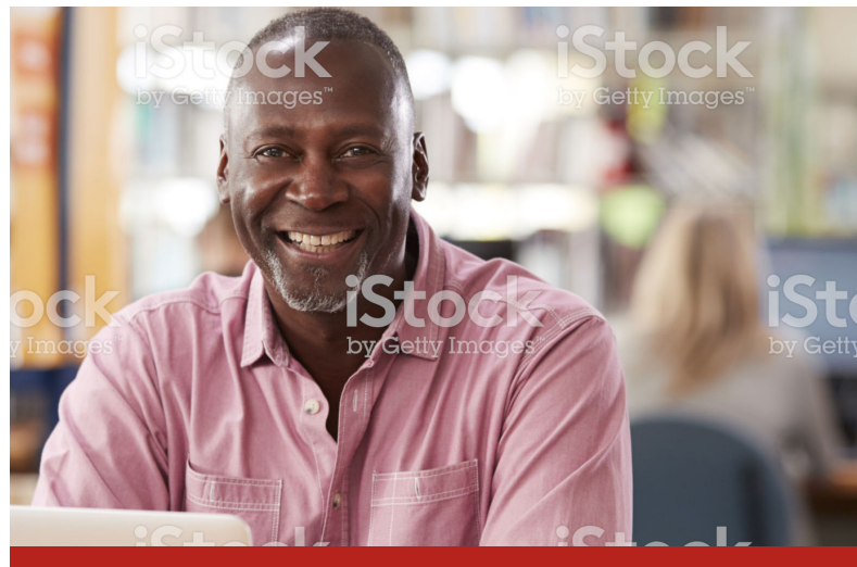
Image caption Omnis earia sundi dolorrovit occuptas et verum, que peli-quo offic tem. Ut ea nam elles sit litate sum unt