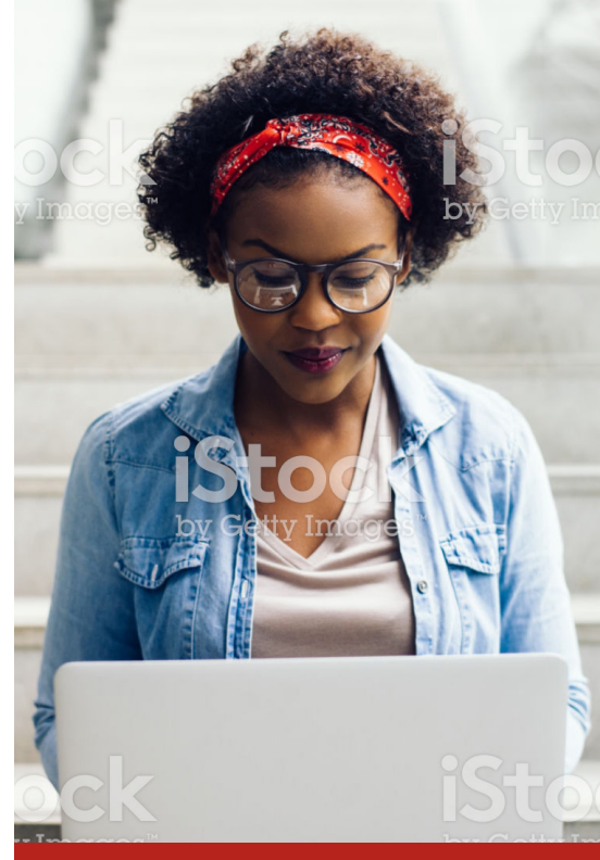
Image caption Omnis earia sundi dolorrovit occupatas et verum, que peliquo offic tem. Ut ea nam elles sit litate sum unt © Photographer Name. Image caption Omnis earia sundi dolorro- vit occupatas et verum, que peliquo offic tem. Ut ea nam elles sit litate sum unt © Photographer Name.