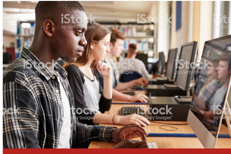
Image caption Omnis earia sundi dolorrovit occuptas et verum, que peli-quo offic tem. Ut ea nam elles sit litate sum unt