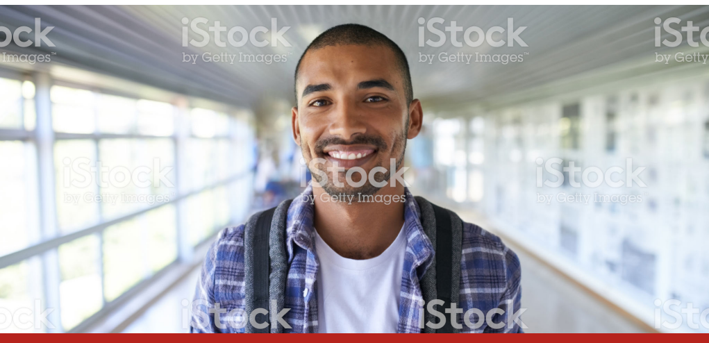
Image caption Omnis earia sundi dolorrovit occupatas et verum, que peliquo offic tem. Ut ea nam elles sit litate sum unt