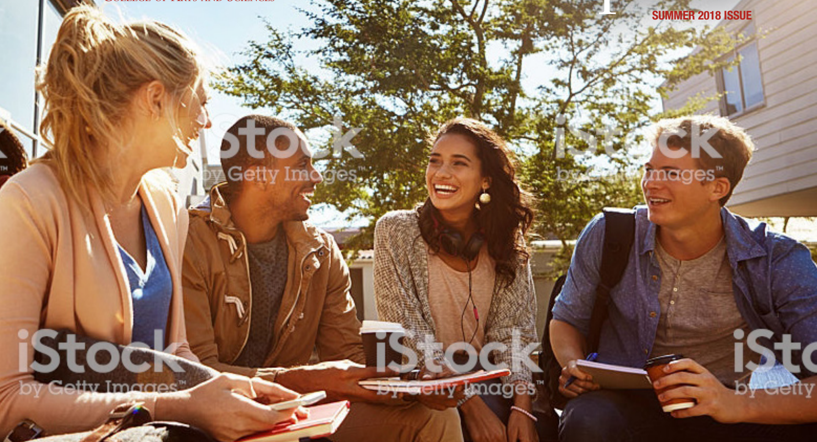
Image caption Omnis earia sundi dolorrovit occuptas et verum, que peliquo offic tem. Ut ea nam elles sit litate sum unt