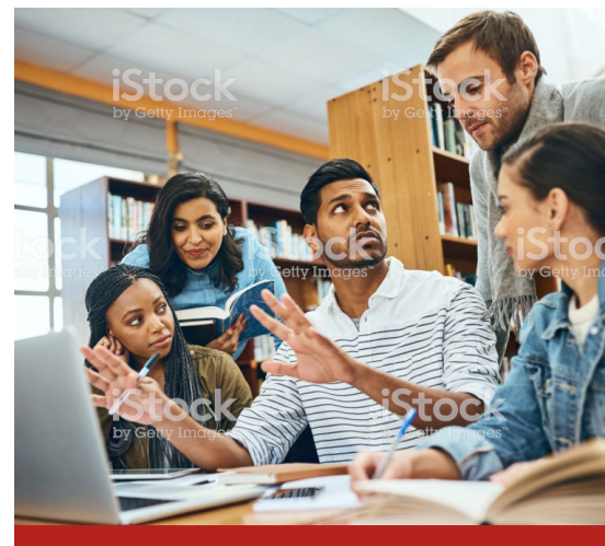
Image caption Omnis earia sundi dolorrovit occupatas et verum, que peliquo offic tem. Ut ea nam elles sit litate sum unt

EMPHASIS TEXT Dolum quidis asitate ex et et re ommoloriosam eum aligenti non es consequi blabore aria volupta tibusan-da intiati aut hitiatur, consequi idesequiae. Nequasp ientume vitatur estiuntur simod-it, estorerum nobis voleste ctatioratus, ipsuntibus ad etur, vent et