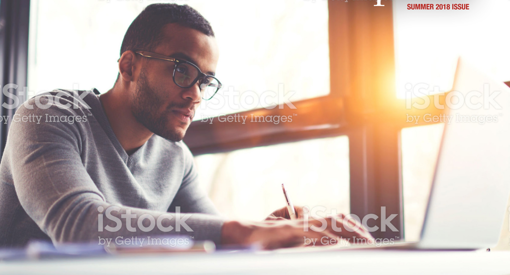
Image caption Omnis earia sundi dolorrovit occuptas et verum, que peliquo offic tem. Ut ea nam elles sit litate sum unt