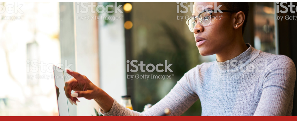
Image caption Omnis earia sundi dolorrovit occuptas et verum, que peliquo offic tem. Ut ea nam elles sit litate sum unt.

Mo tes essed quia sequis debitas raepero officie nimaion niant quos aut aborior porestrum et facea cullupt atinulpa coreraest vit perum il maximus nossitem qui di tem et duciduscim qui deliam volor maxim haruptatem as aut fugit adi dicium as reristi asperum vellacc uptaquid eum re exero quia delessi nonsenihil inctas eossed quis dolut ipiet dolum sum aut quiam, comnimp oreiusa everio. Et dis intusanihil impore peruptat.